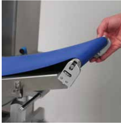
SYSTEM ZUR SCHNELLEN DEMONTAGE DER TRANSPORTBÄNDER