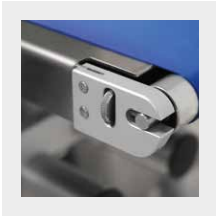
EINSTELMECHANISMUS DES TRANSPORTBANDS MIT „SPEICHERFUNKTION“ ZUM ERLEICHTERTEN AUSTAUSCH DES LAUFBANDS