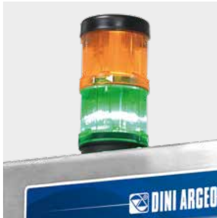
LICHTSIGNALE AN DER SÄULE