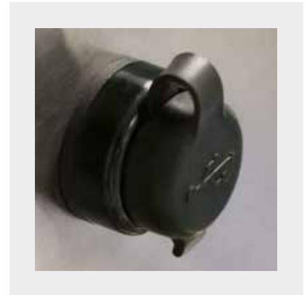
PORT FÜR USB-ANSCHLUSS